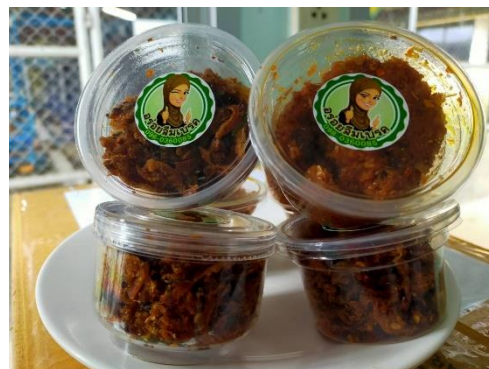
ผลิตภัณฑ์น้ำพริกปลาหยอง

ผลผลิตจากเฟส 1 ของน้องบ้านปากคลอง พร้อมออกสู่ตลาดในเร็วนี้จ้จ้า.... สู่การต่อยอดในเฟส 2 เห็นแล้วชื่นใจ #บายโซ นายโซ 🥰🥰🥰