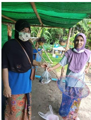
ผลผลิตปลาและการแปรรูปภายในชุมชน

ความสำเร็จของการดำเนินโครงการบริการวิชาการแก่ชุมชนคือ การสร้างโอกาสให้แก่กลุ่มเป้าหมายในการสร้างอาชีพในด้านการเลี้ยงหอยนางรม การเลี้ยงปลาและการแปรรูป การที่ชุมชนสามารถต่อยอดกิจกรรมที่ทางโครงการเข้าไปส่งเสริม ถ่ายทอดองค์ความรู้หลังจากเสร็จสิ้นโครงการ ได้แก่ เป็นแหล่งเรียนรู้ศึกษาดูงานของหน่วยงานต่าง ๆ มีอาชีพที่สามารถเลี้ยงตนเองและครอบครัวได้ส่งผลให้มีรายได้จากการการเลี้ยงหอยนางรมและการเลี้ยงปลาและการแปรรูปเพิ่มขึ้น รวมทั้งกลุ่มเป้าหมายที่เข้าร่วมโครงการที่เป็นเยาวชนที่ไม่เรียนหนังสือ ไม่มีอาชีพขอเงินพ่อแม่ในการใช้จ่าย แต่หลังจากทางทีมเข้าไปสนับสนุนและส่งเสริมกลุ่มนี้เค้าจะมีความรับผิดชอบในหน้าที่ สามารถเป็นผู้นำคนอื่นได้ และสามารถมีรายได้จากการเป็นวิทยากรผู้ช่วยอีกด้วย