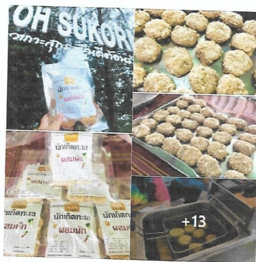
U2T ตำบลเกาะสุกร 16 กรกฎาคม เวลา 23:53 น. วันนี้อยู่บ้านเอง ผลิตภัณฑ์ใหม่ "บักกั๊ดทะเล" รวมวัตถุดิบที่มีอยู่ในท้องทะเลมาปรุงรสจัดให้เป็นเมนูที่พิเศษ มีการนำผลิตภัณฑ์เครื่องแกง มาผสมเพื่อความคงตัว กลมกล่อมในทุกการสัมผัส เหมาะสำหรับเป็นของทานเล่น หรือจะเป็นของฝาก มีทั้งสูตรดั้งเดิม และสูตรเครื่องแกง ใหญ่... ดูเพิ่มเติม