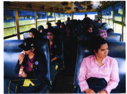
เดินทางออกจาก มทร.ตรัง ไปบ้านโต๊ะบัน ตำบลบ่อน้ำ อำเภอสีเกา จังหวัดตรัง