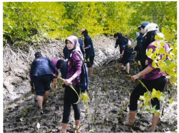
บรรยายภาคขณะปลูกโกงกาง