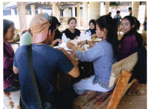
รับประทานอาหาร

(หมายเหตุ ภาพกิจกรรมไม่เกิน ๖ ภาพ พร้อมประกอบคำบรรยาย)