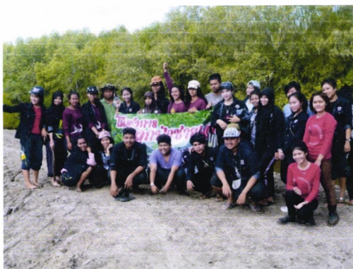
ร่วมถ่ายรูปเป็นที่ระลึก