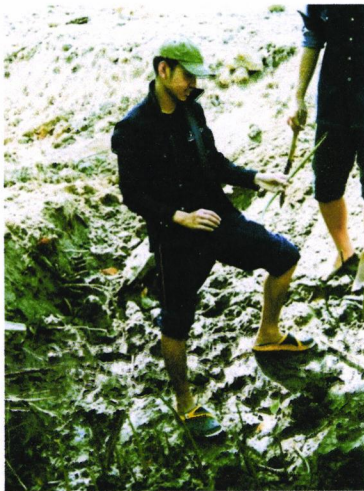
สาธิตวิธีการปลูก