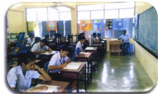
นักเรียนระดับชั้นมัธยมศึกษาตอนปลาย กำลังทำข้อสอบโครงการตอบปัญหา ธรรมะทางก้าวหน้า

(หมายเหตุ ไม่เกิน ๖ รูป พร้อมแนบไฟล์ JPEG Image ด้วย)