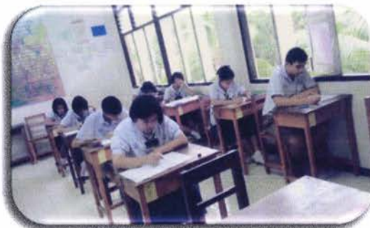
นักเรียนระดับชั้นมัธยมศึกษาตอนปลายกำลัง ทำข้อสอบโครงการตอบปัญหา ธรรมะทางก้าวหน้า