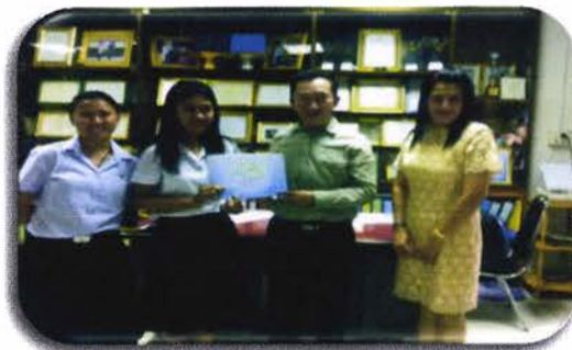
มอบเกียรติบัตรที่เป็นศูนย์สอบและ ของที่ระลึกแก่ ผู้อำนวยการ โรงเรียน