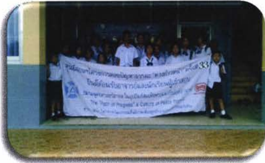
ภาพรวมเด็กนักเรียนก่อนวันสอบในโครงการ จัดสอบตอบปัญหาธรรมะทางก้าวหน้า ครั้งที่ ๓๓