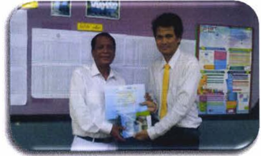
มอบเกียรติบัตรที่เป็นศูนย์สอบและของที่ ระลึกแก่ ผู้อำนวยการโรงเรียน