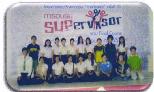
รวม Supervisor จากมทร.ตรัง และ ม.ทักษิณ สงขลา