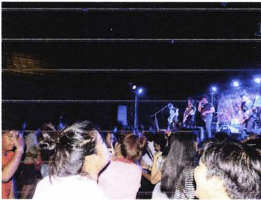
การแสดงของที่ 2