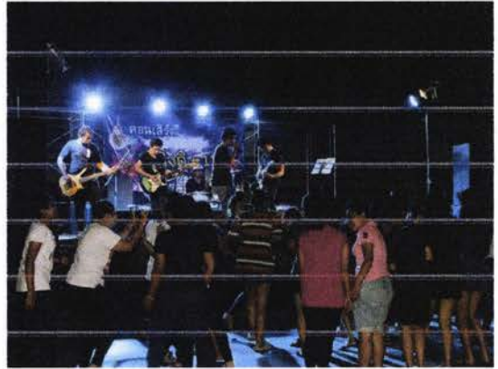
การแสดงของวงที่ 1