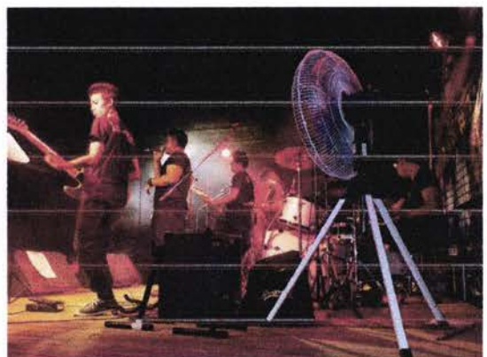
ปิกคำแนน โอเวอร์ โดส