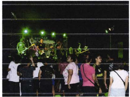
การแสดงของวงที่ 3