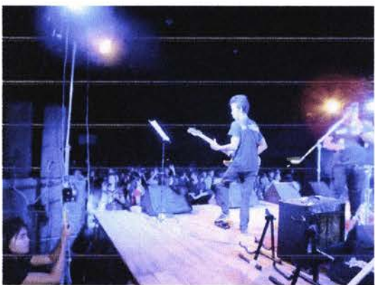
เริ่มเข้าสู่ความมันของคอนเสิร์ต