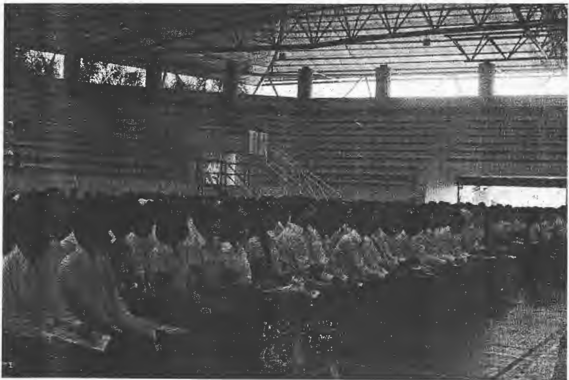
นักศึกษาให้ความสนใจในการบรรยาย และให้ความร่วมมือในการแสดงออก