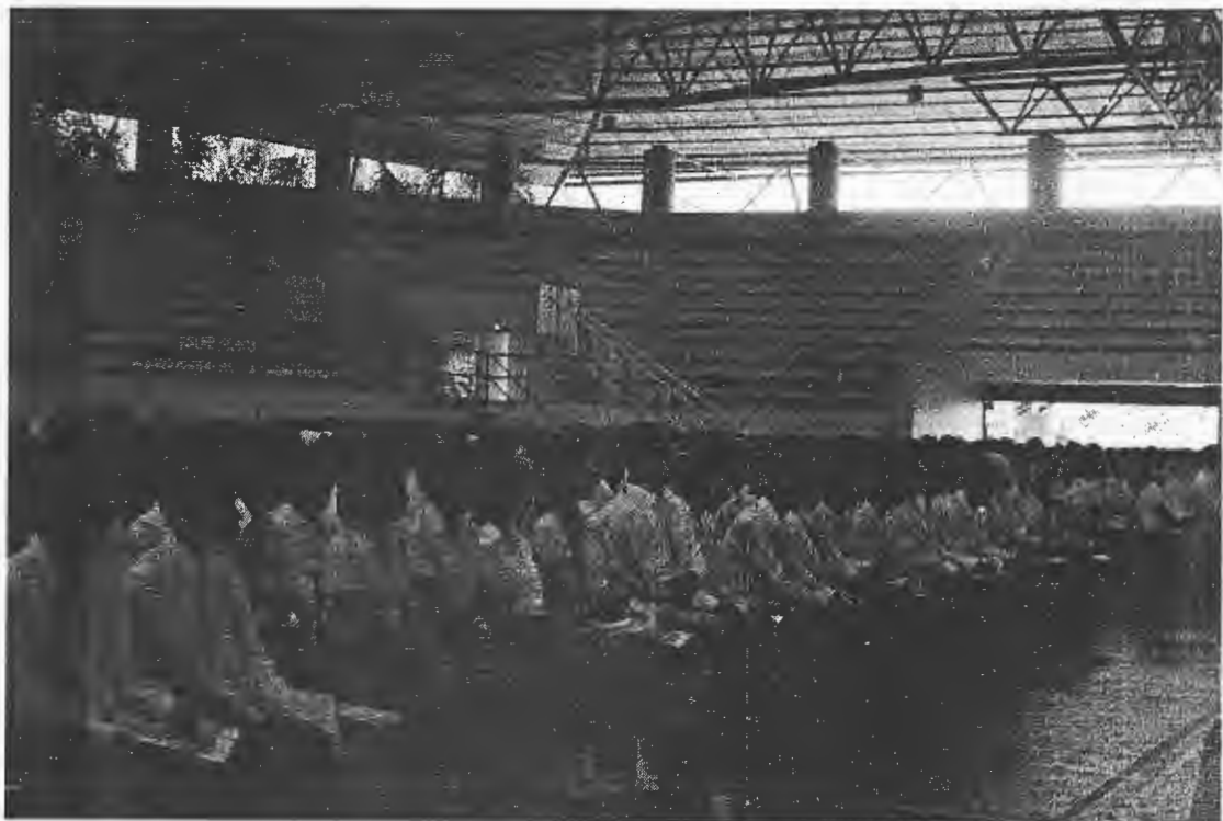
บรรยากาศนักศึกษาใหม่ประจำปีการศึกษา 2556 เข้าร่วมพิธีปฐมนิเทศ จำนวน 679 คน 21 - 22 พฤษภาคม 2556 ณ อาคารกีฬารามงคลตรง