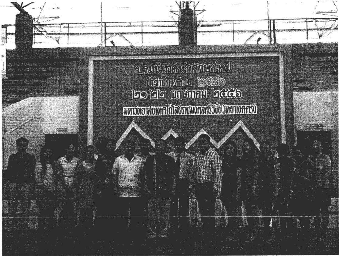
ผู้บริหารและคณาจารย์ถ่ายภาพร่วมกับนายกสภามหาวิทยาลัยเทคโนโลยีราชมงคลศรีวิชัย