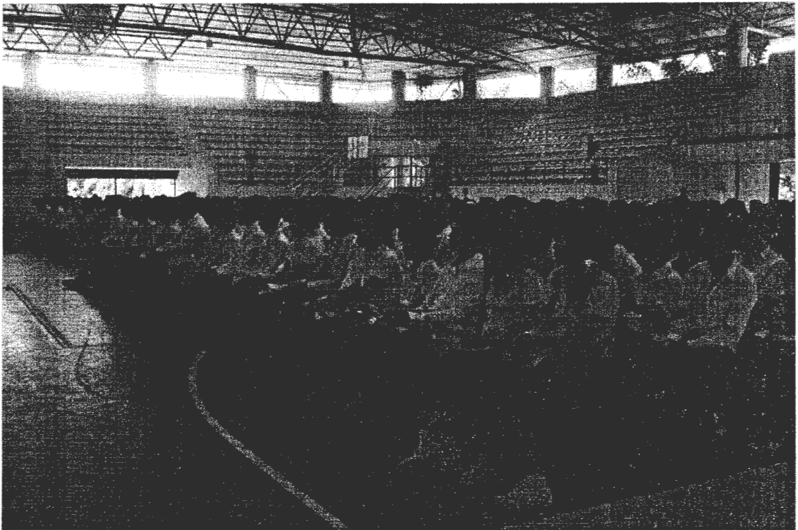
บรรยากาศในภาคบ่าย 22 พ.ค. 56 นักศึกษายังคงเข้าร่วมและมีความสนใจเช่นเดียวกับในภาคเช้า