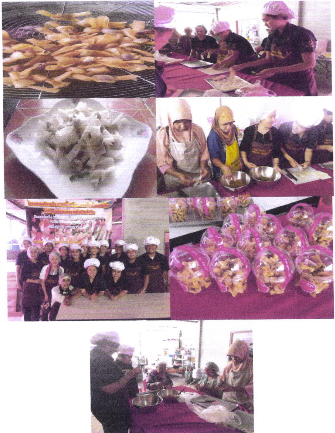
ภาพกิจกรรมการดำเนินโครงการ