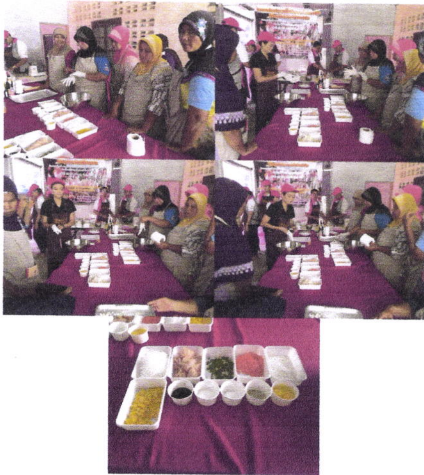
ภาพกิจกรรมการดำเนินโครงการ