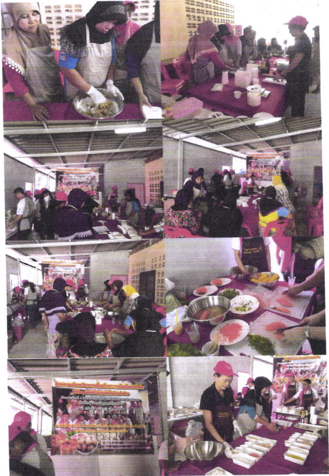
ภาพกิจกรรมการดำเนินโครงการ