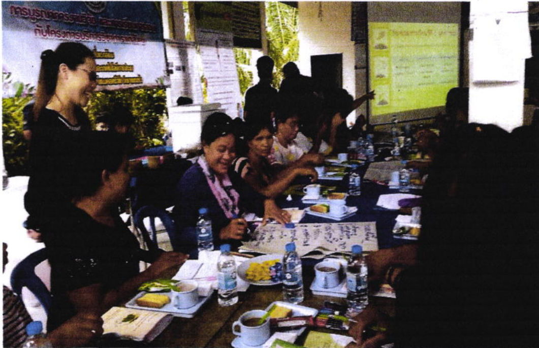
กิจกรรมระดมความคิดเห็นขยะมูลฝอย