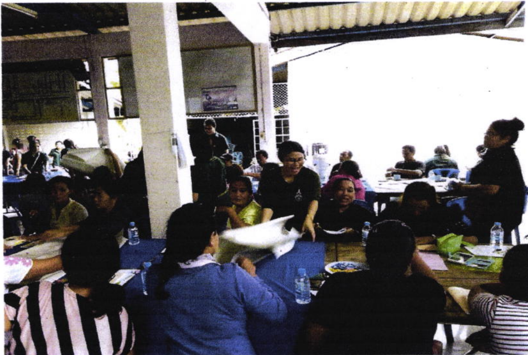
กิจกรรมระดมความคิดเห็นขยะมูลฝอย