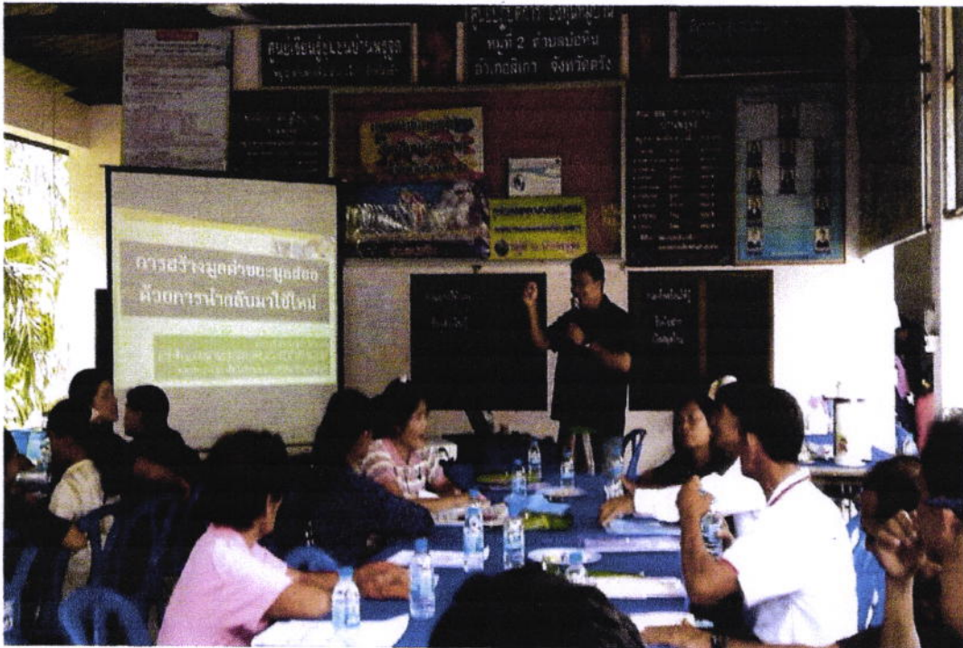
บรรยายการสร้างมูลค่าขยะมูลฝอย