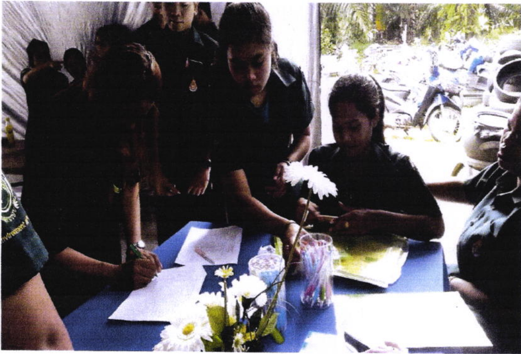
ภาพที่ 1 ลงทะเบียน