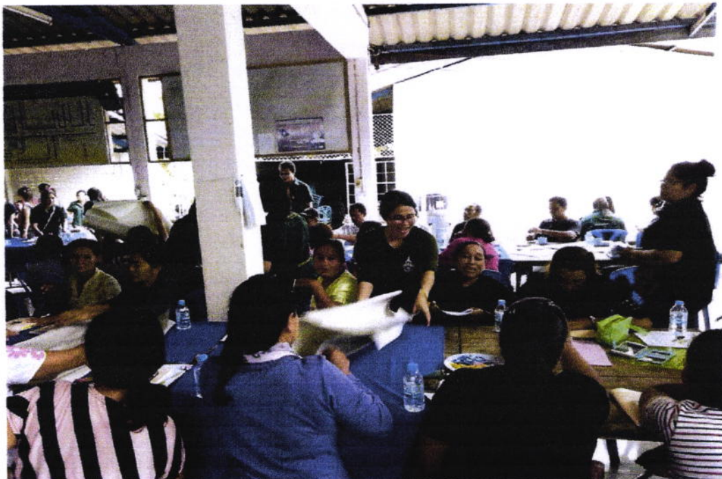
กิจกรรมระดมความคิดเห็นขยะมูลฝอย