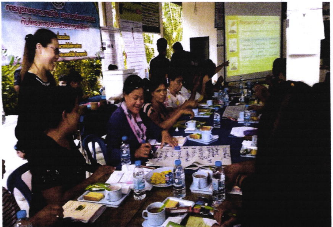
กิจกรรมระดมความคิดเห็นขณะมุขฝอย