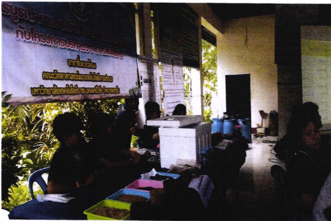
ภาพที่ 2 การบูรณาการงานวิจัยและการเรียนการสอน