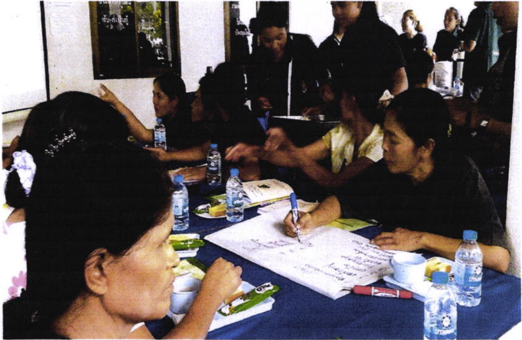
กิจกรรมระดมความคิดเห็นขณะมุขฝอย