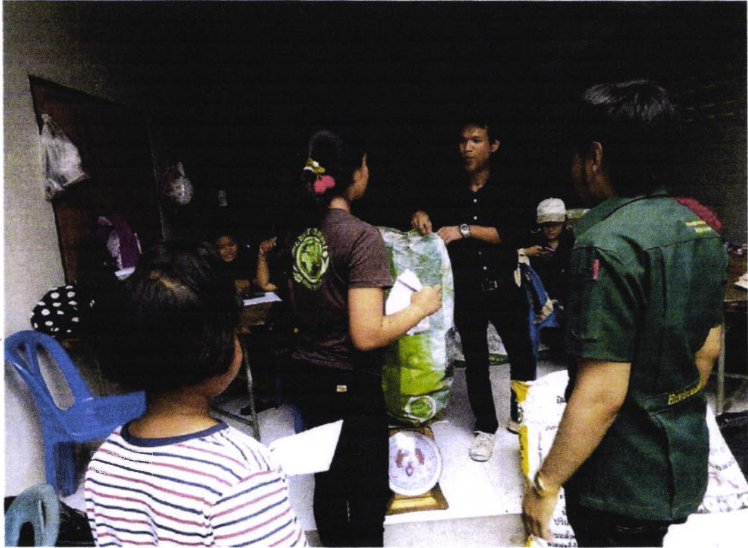
กิจกรรมขยะแลกไข่