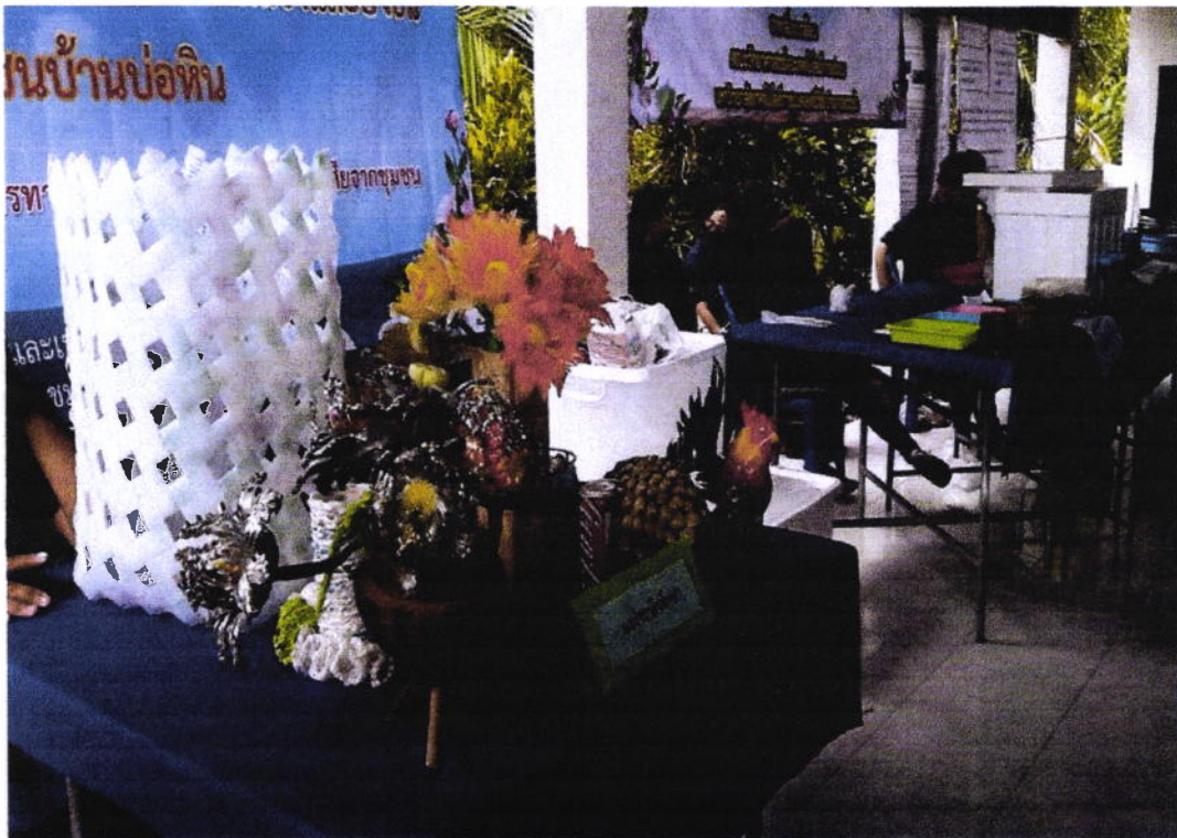
ผลงานนักศึกษา