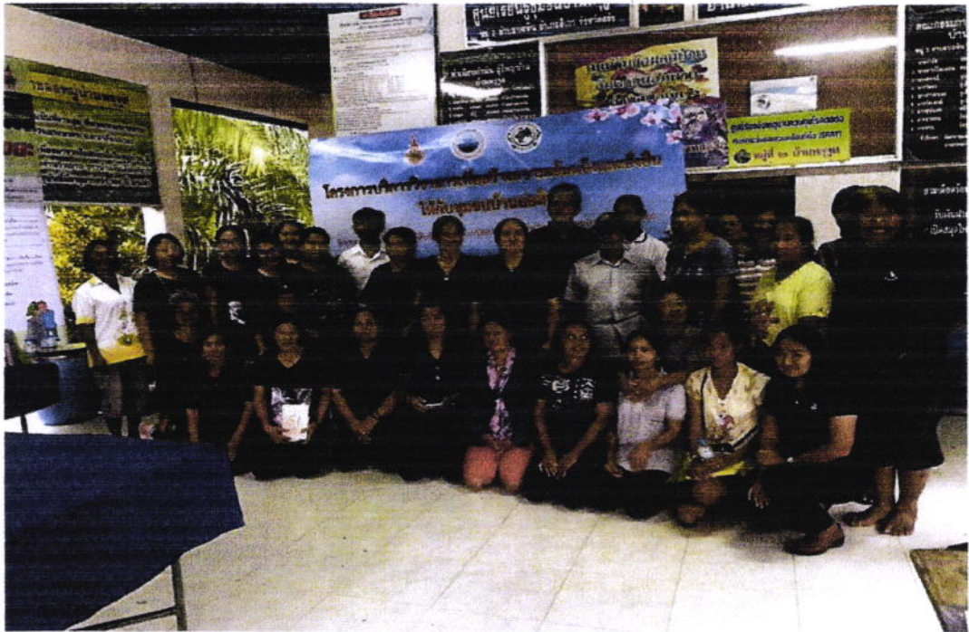
ปิดโครงการบริการวิชาการ

6. เอกสาร / หลักฐานการเผยแพร่ความรู้ (ถ้ามี) ตามเอกสารแนบ