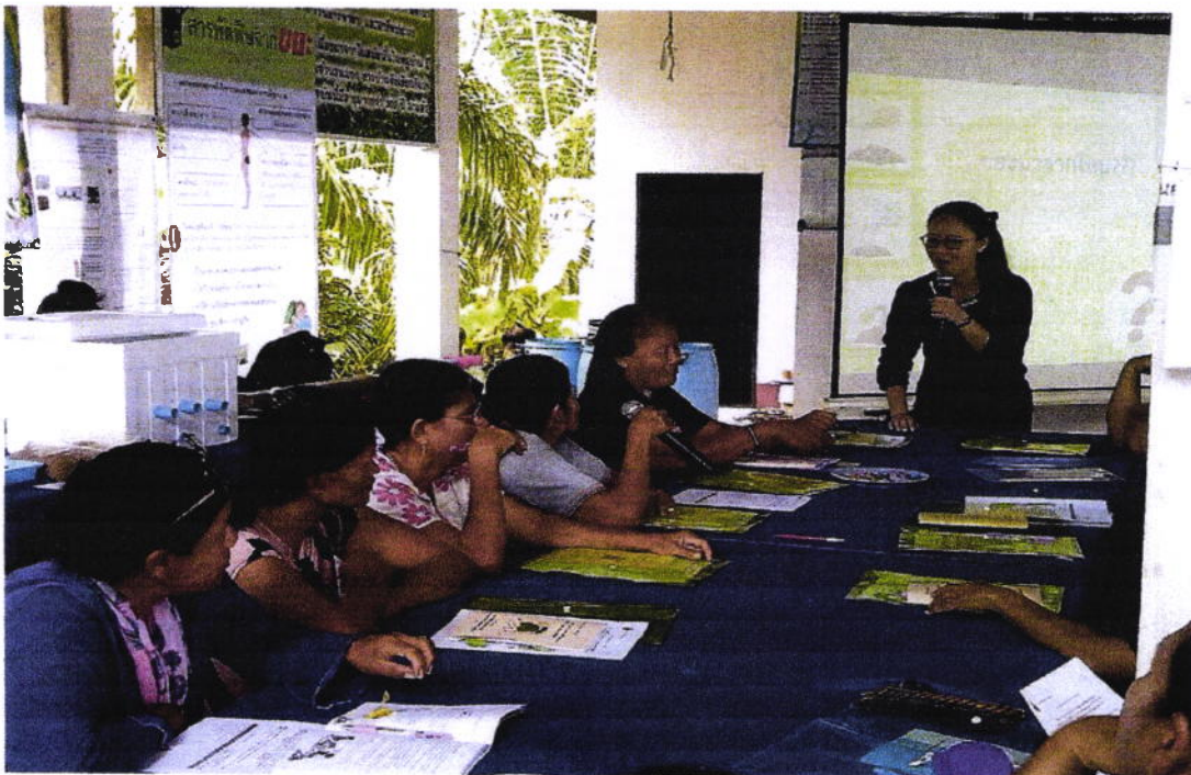
ขยะมาจากไหน