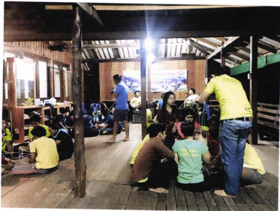
๓. กิจกรรมหอคอยความสามัคคี