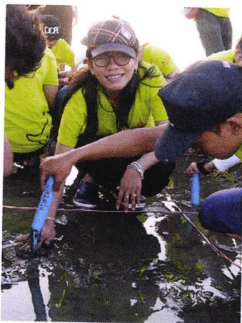
๕. กิจกรรมปลูกหญ้าทะเล