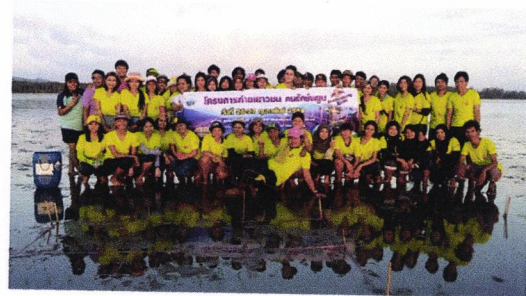
๖. ปิดโครงการ