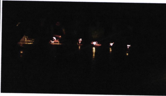
๑. กิจกรรมจุดไฟนักกิจกรรม