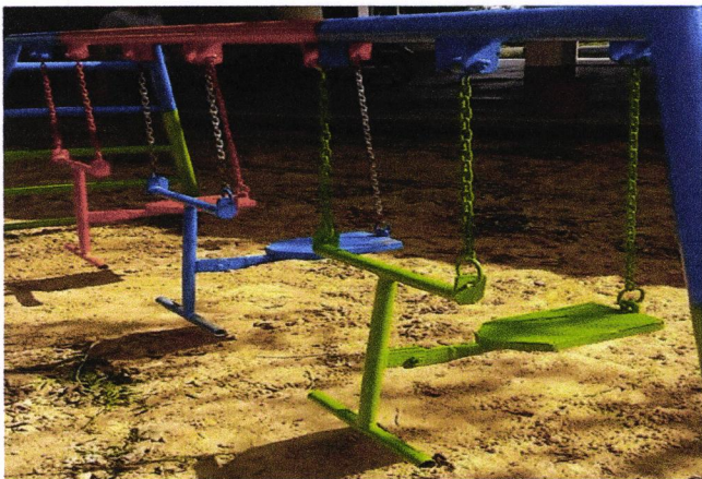
ภาพที่ ๓ ตกแต่งสนามเด็กเล่นให้พื้นเสมอกัน