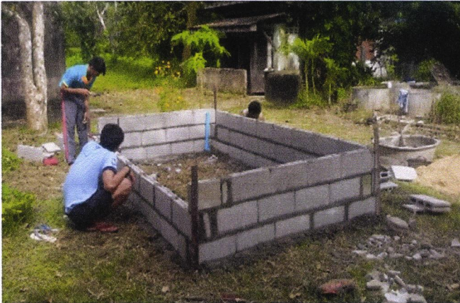
ภาพที่ ๑ ทำบ่อปลาตุ๊ก