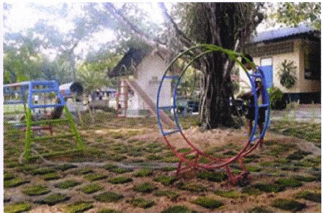
ภาพที่ ๔ ปลูกรูหญ้าในสนามเด็กเล่น