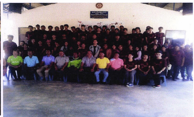
ภาพที่ ๖ ถ่ายรูปร่วมกัน