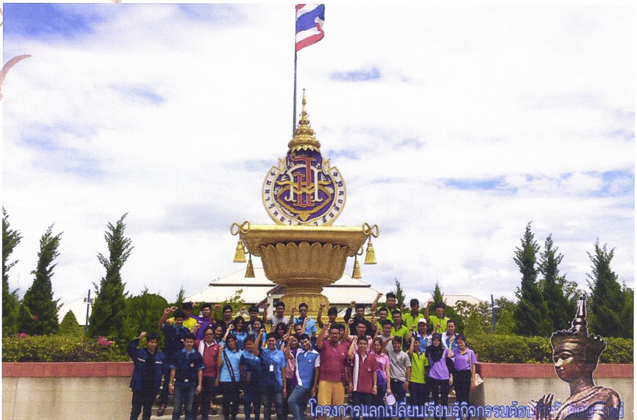
โครงการแลกเปลี่ยนเรียนรู้กิจกรรมต้อนรับนักศึกษาใหม่