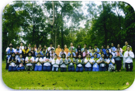
ภาพหมู่ก่อนแยกย้าย