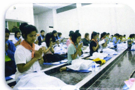
น้องปฏิบัติธรรม

(หมายเหตุ ไม่เกิน 6 รูป พร้อมแนบไฟล์ JPEG Image ด้วย)