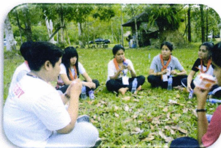
ประชุมกลุ่มย่อยหลังนันทนาการ