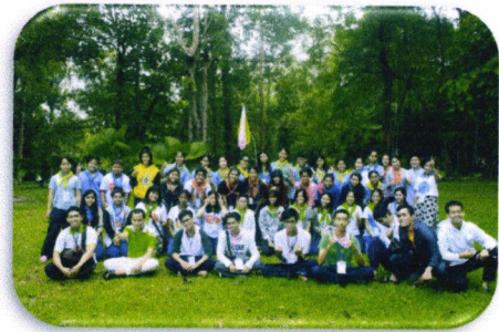
ภาพหมู่หลังนันทนาการ